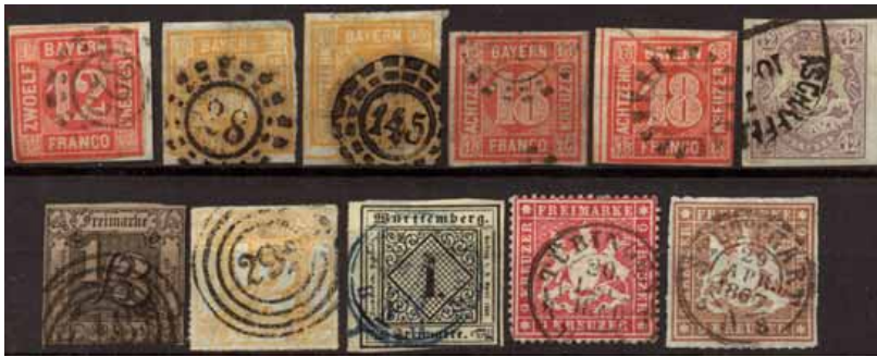
ex 448 1:1,3