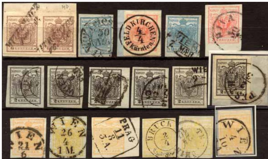
ex 917 1:1,4