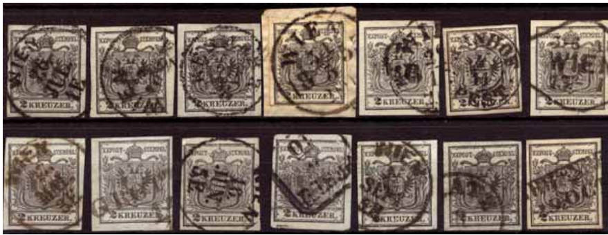
ex 916 1:1,3