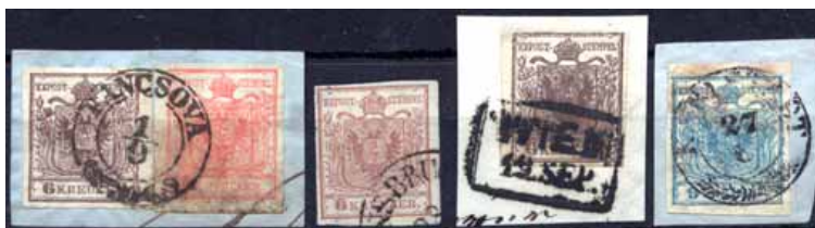
ex 918 1:1,3