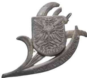
ex 4214 (1:1)