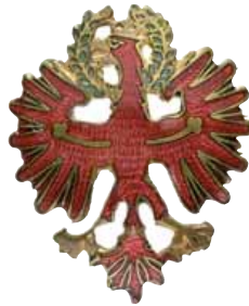
ex 4231 (1:1)