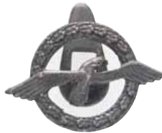
ex 4215 (1:1)