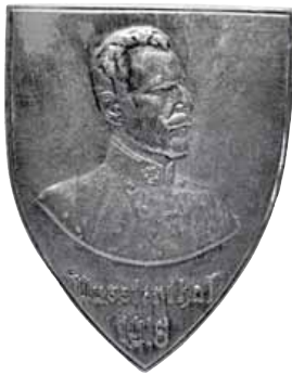
ex 4202 (1:1)