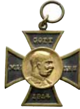
ex 4230 (1:1)