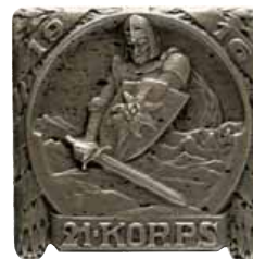
ex 4180 (1:1)