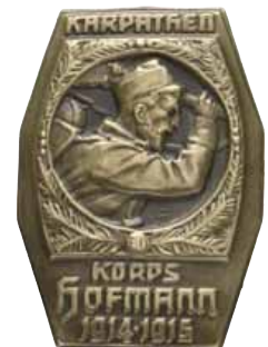
ex 4181 (1:1)