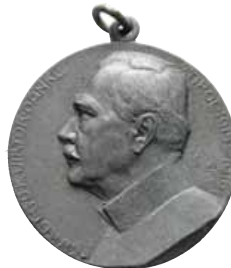
ex 4207 (1:1)