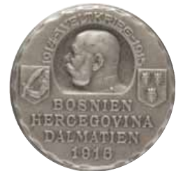
ex 4199 (1:1)