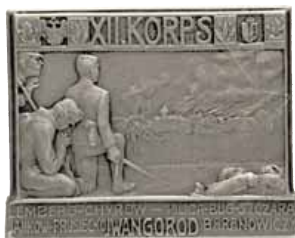
ex 4178 (1:1)