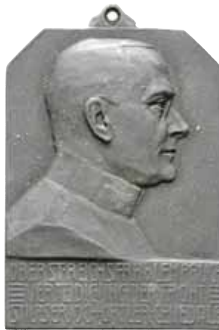
ex 4206 (1:1)