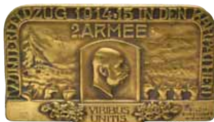
ex 4216 (1:1)