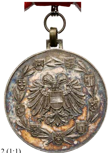
ex 4012 (1:1)