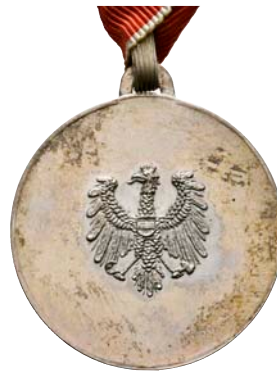
ex 4011 (1:1)