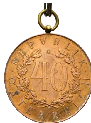
ex 4032 (1:1)