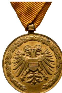
ex 4019 (1:1)