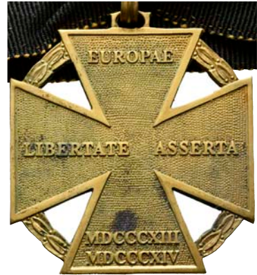
ex 4039 (1:1)