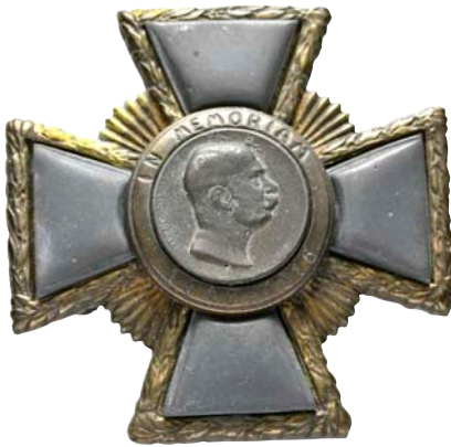
ex 4062 (1:1)