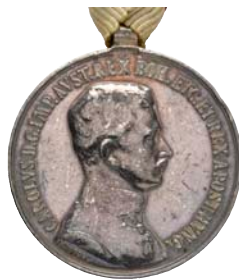
ex 4072 (1:1)