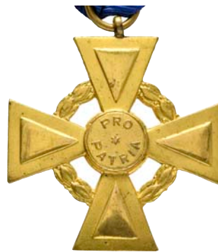
ex 4031 (1:1)