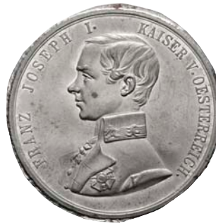
ex 4063 (1:1)