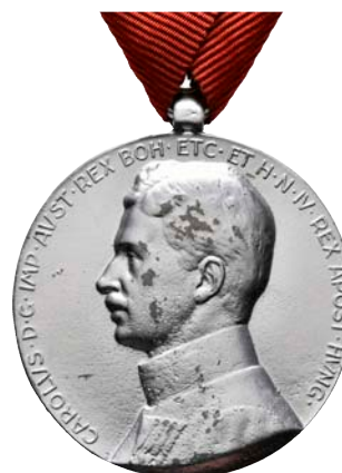
ex 4122 (1:1)