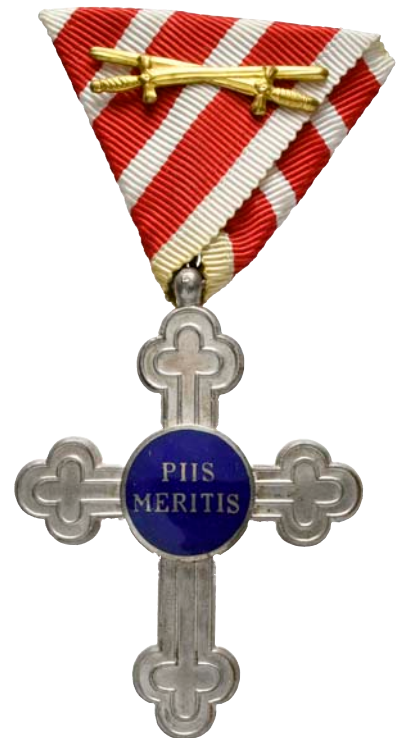
ex 4109 (1:1)