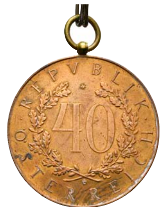
ex 4032 (1:1)