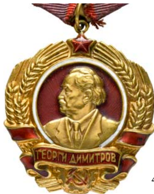
4275 Au (1:1)