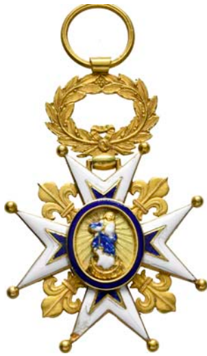
4373 Au (1:1)