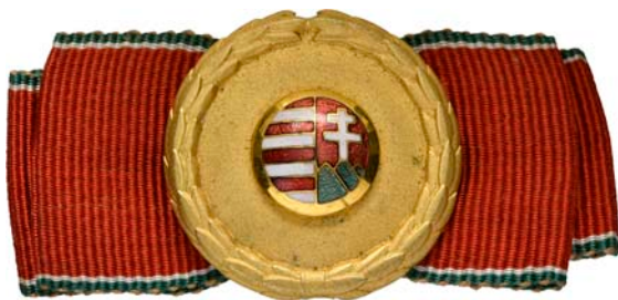
ex 4377 (1:1)