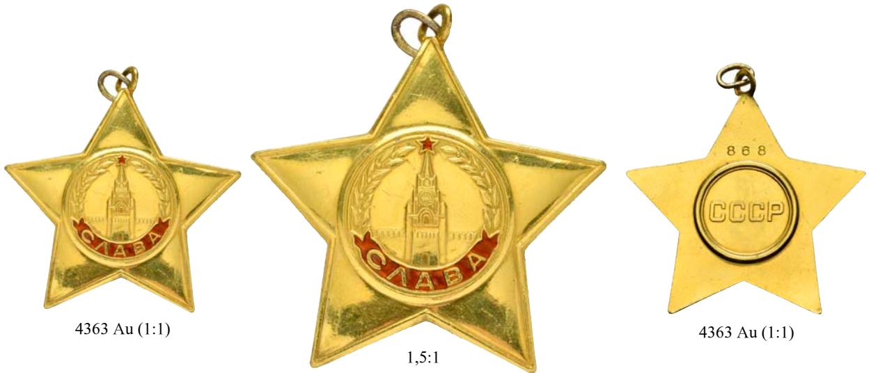
4363 Au (1:1)