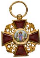
4312 Au (1:1)