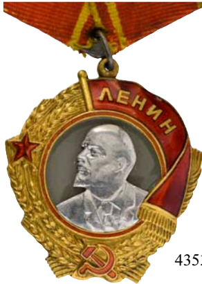
4353 Au (1:1)