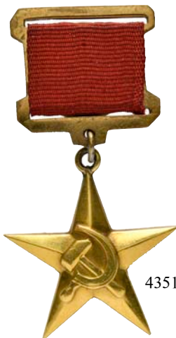
4351 Au (1:1)