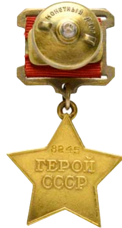
4350 Au (1:1)