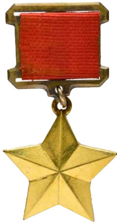
4350 Au (1:1)