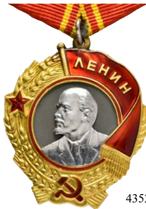
4352 Au (1:1)